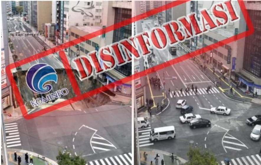
Foto: Jalan ambles di Fukuoka diperbaiki hanya dalam 2 hari (Kyodo News)